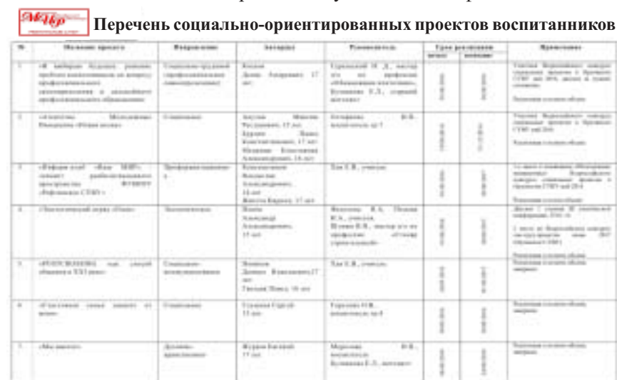
Фрагмент электронной базы данных «Копилка идей» социальных проектов обучающихся Рефтинского СУВУ